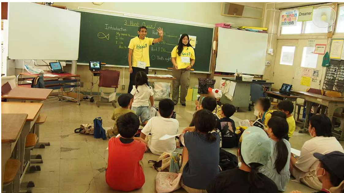
いずれのプログラムも「英語を学ぶ」のではなく、「英語を手段として学ぶ」イメージ教育をコンセプトにしている

イベントでは、そのほかにも「オススメの国、場所を紹介しよう」「3ヒントクイズを出し合おう」「たし算・ひき算の問題を出し合おう」「伝言ゲームをしよう」「『うちわ』を作ろう」「『風鈴』を作ろう」など12のプログラムが用意されていた。いずれも「英語を学ぶ」のではなく、「英語を手段として学ぶ」イメージ教育をコンセプトにしている。