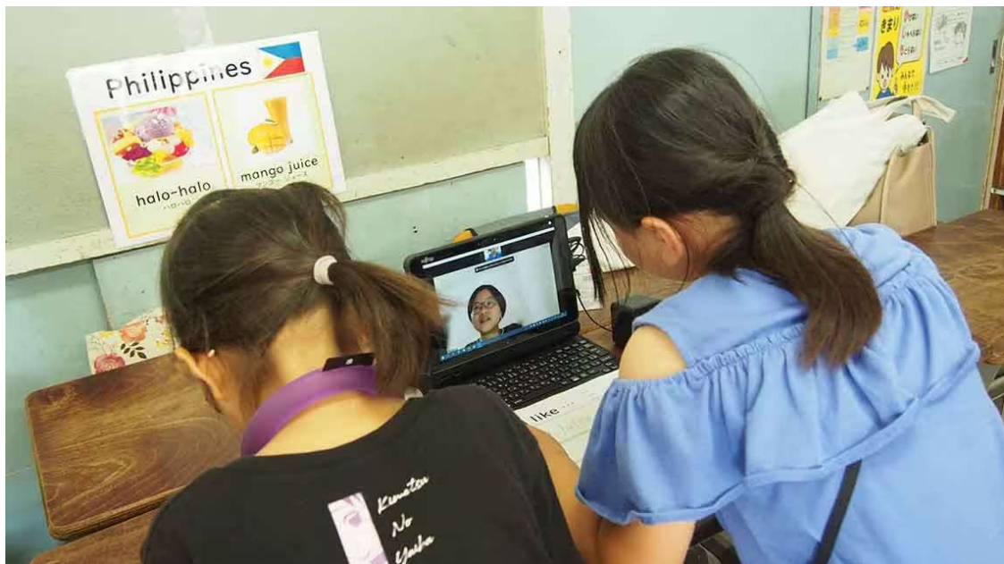
端末の向こうにいるALTを店員に見立てて、料理を注文する児童

こうした「店員と客のやり取り」を全員一緒に学んだ後、グループに分かれて、教室の脇に設置された端末の前に集う。画面の先には別のALTで、今度は1対1で食べ物を注文するやり取りを実践する。料理に合わせて、その国出身のALTが画面の向こうにいるのが、何ともリアルだ。